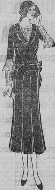
Este modelo presenta una atractiva combinación en que los pliegues de la falda forman un doble lazo en el talle. Las mangas y el cuello lucen encaje

En vista de que el gobierno logró conseguir el dinero suficiente, la secretaria de hacienda dispuso reformar el aviso publicado en la Gaceta anunciando el pago de sueldos, para esta semana, no mayores de 150 colones. Según esa reforma, ahora el pago se hará así: Martes, giros no mayores de 150 colones. Miércoles, los giros no mayores de 400 colones. Lunes de pascua, todos los demás giros.